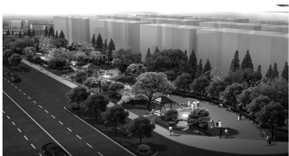
图3 1号街旁绿地设计效果

绿地呈狭长型,东段以流畅婉转的曲线构成自然水景,水中设仙鹤群雕,水景通过绿地中心的圆形亲水平台自然过渡至西段的铺地与绿化,平台上设置临水景亭,植物造景以自然组团式布置,形成层次丰富的生态型自然植物群落,水岸边种植水生、湿生植物,场地中既有开阔的广场铺地又有大片浓郁的林荫树阵,既有灵动水景及丰富多姿的湿生植物景观,又具幽静的休闲设施,为附近居民提供了一个体验水绿生态的休闲活动场所(见图3)。