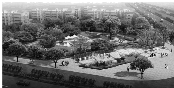
图5 10号街旁绿地设计效果 (下转第52页)

10号街旁绿地总体布局构图提炼于盐城的路网形式,纵横交错的园路及铺装地,形似盐城四通八达的道路系统,水面及流动白沙铺地形似城市水系,树阵广场搭配规则园路,自然驳岸及水生植物搭配自然水系,体现了盐城的现代与自然完美结合;11号街旁绿地布局中蜿蜒曲折的水系、白沙铺地提炼自盐城的水系布局,水系周边是丰富的水生植物及大面积植被,体现了盐城丰富的水网及良好的自然生态环境,突出了盐城自然地域文化特征。入口广场结合树池及醒目的水景墙,既有活动空间又突出广场主题,起到画龙点睛的效果(见图5)。