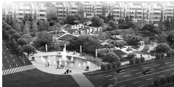
图4 8号街旁绿地设计效果

3.4.5 蓝色主题——路网水网文化 10、11号街旁绿地,位于人民南路东西2侧,南环路北侧,面积均约为6 400 m 2 ,2侧临路,周围为规划居住区和村庄。场地内地势南低北高,高差不大,周边种植少许树木。