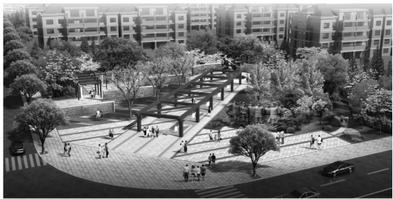
图2 2号街旁绿地设计效果

绿地呈狭长型,东段以流畅婉转的曲线构成自然水景,水中设仙鹤群雕,水景通过绿地中心的圆形亲水平台自然过渡至西段的铺地与绿化,平台上设置临水景亭,植物造景以自然组团式布置,形成层次丰富的生态型自然植物群落,水岸边种植水生、湿生植物,场地中既有开阔的广场铺地又有大片浓郁的林荫树阵,既有灵动水景及丰富多姿的湿生植物景观,又具幽静的休闲设施,为附近居民提供了一个体验水绿生态的休闲活动场所(见图3)。